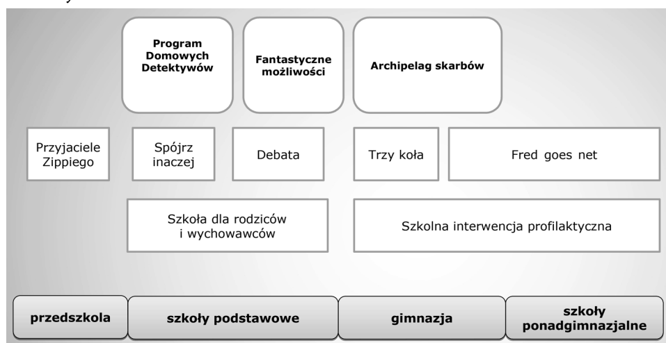
Ryc. 3. Rekomendowane programy profilaktyki uzależnień na różnych szczeblach edukacji.

się np. stworzyć sieć klubów. W Płocku funkcjonuje obecnie 21 placówek wsparcia dziennego: 8 klubów profilaktyki środowiskowej i 13 świetlic. W placówkach organizowany jest czas wolny, realizowane są programy socjoterapeutyczne, profilaktyczne, udzielana jest pomoc w nauce, kryzysach szkolnych, rówieśniczych, osobistych oraz prowadzone jest dożywianie. W zajęciach prowadzonych w placówkach wsparcia dziennego w 2016