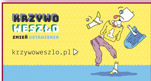
Plakaty kampanii 1