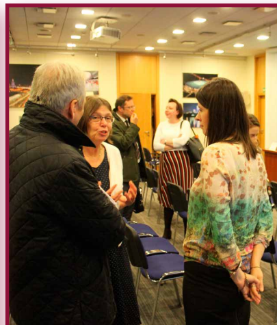
Konferencja prasowa poświęcona kampanii