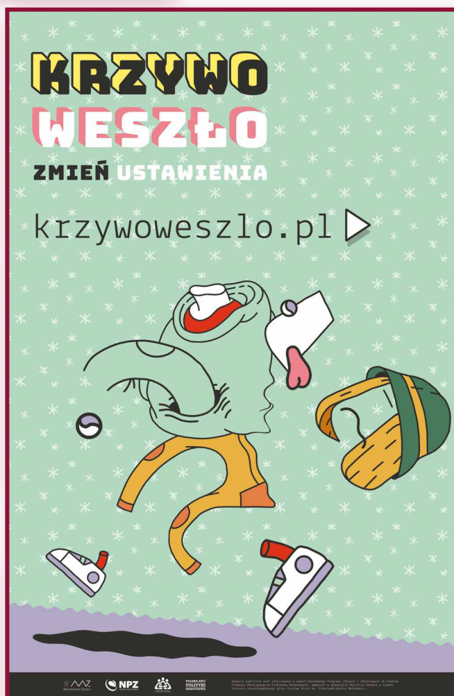
Plakat kampanii 2