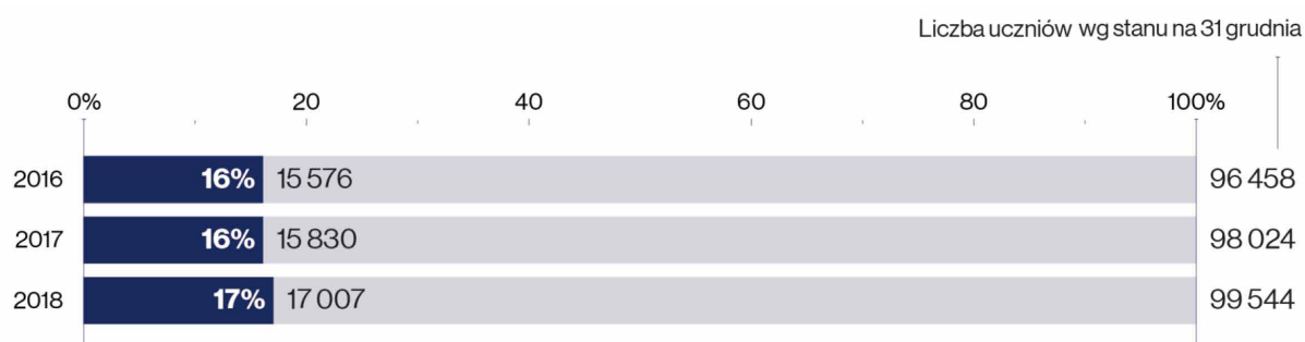
Wykres 3. Odsetek oraz liczba uczniów uczestniczących w rekomendowanych programach profilaktycznych.