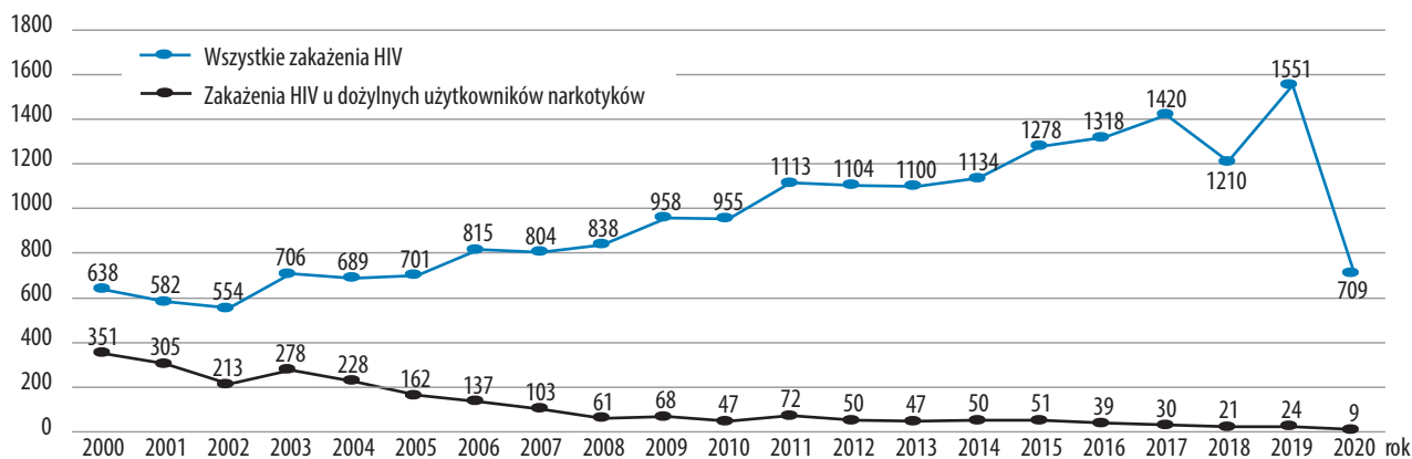
Wykres 2. Liczba nowych zakażeń HIV, włącznie z iniekcyjnymi użytkownikami narkotyków, wykrytych w latach 2000–2020.